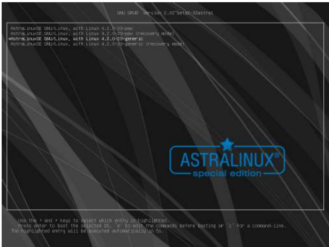
Рис. 1 – Окно запуска ОС

При запуске ОС появляется окно, вид которого представлен на рис. 1.