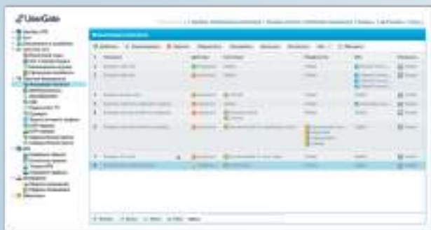
Фильтрация контента в UserGate

UserGate C100 предлагается по минимальным ценам, что делает его доступным для небольших организаций, а также для использования в филиалах, таких, например, как точки продаж. Данное устройство поставляется практически готовым к использованию и его настройка может быть произведена обычным системным администратором. UserGate C100 может использоваться в сетях с шириной канала пропускания до 2 Гб/с.